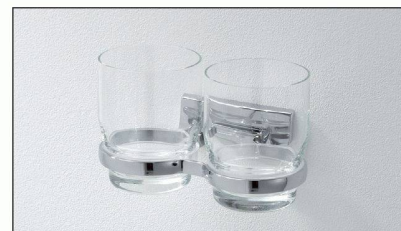
Das neue, noch einmal reduzierte Design der Accessoires-Serie CHIC von Bodenschatz. Jetzt erhältlich!

Wer die Bäder von Mietwohnungen mit CHIC ausstattet, ist auf der sicheren Seite: Die Kombination „günstiger Preis für langlebige und schöne Accessoires“ findet bei der Bauherrschaft ebenso Gefallen wie bei den Mieterinnen und Mietern. Sicherheit verspricht auch die Nachliefergarantie für neue und für bisherige Modelle. Umfassende Informationen zu CHIC sind erhältlich bei der Bodenschatz AG.