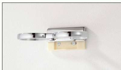
Der Flansch wird an der Wand befestigt, die Accessoires werden ganz einfach darüber geschoben.