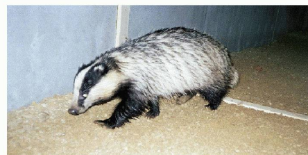
Wildtierunterführung unter dem Autobahnzubringer N3 / A98 in Rheinfelden (AG), durchquert von einem Dachs. Mit Fotos, Infrarotkameras und genetischen Methoden kann man messen, ob Grünbrücken und Unterführungen tatsächlich benutzt werden