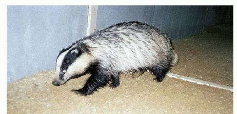
Wildtierunterführung unter dem Autobahnzubringer N3 / A98 in Rheinfelden (AG), durchquert von einem Dach. Mit Fotos, Infrarotkameras und genetischen Methoden kann man messen, ob Grünbrücken und Unterführungen tatsächlich benutzt werden