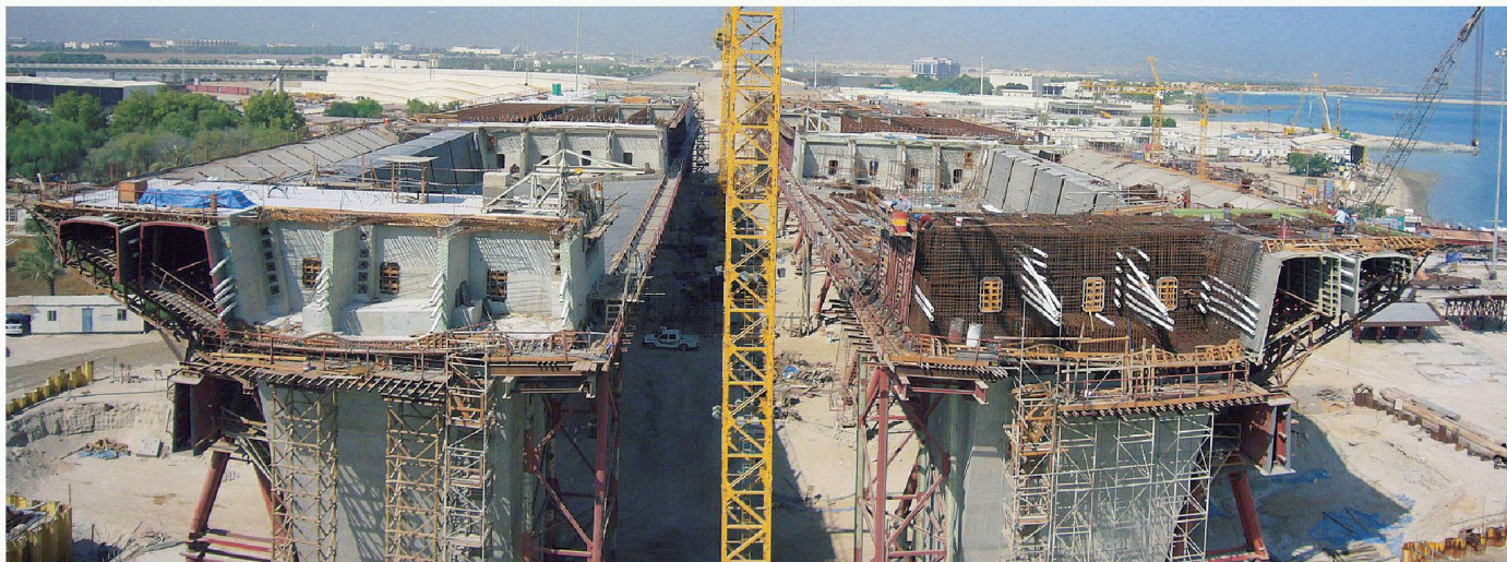
Shaikh Zayed Bridge von Zaha Hadid: Der Oberbau der Brücke wird in zwei getrennten Kastenträgern erstellt. Die Fahrbahn, mit vier Spuren pro Richtung, wird mit Hängkabeln an den Stahlbögen aufgehängt