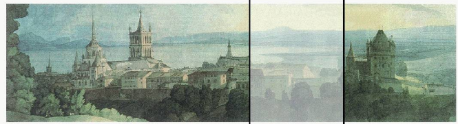
«Vue de Lausanne» par Francis Towne, 1781 (Fitzwilliam Museum, Cambridge)

Mettre en résonance le bâti existant avec les exigences contemporaines et marquer la volonté de renouveler le lien démocratique entre un peuple et ses institutions, tel est le défi de la construction du nouveau parlement.