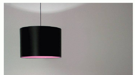
Victoria Trade AG | 6340 Baar www.victoriatrade.ch