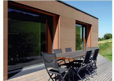
Sabez AG | 8604 Volketswil www.sabez.ch

gehören die steinähnliche Festigkeit, die Naturholzästhetik und die Pflegeleichtigkeit. Rockpanel ist zu 100% recycelbar und erzeugt auch langfristig keine umweltschädlichen Abfälle. «Rockpanel Colours» schlägt zudem zwanzig Standardfarben vor und ermöglicht viele Kombinationen. Bei Bedarf kann die Oberflächenverkleidung auch nach Mass und in ganz individuellen Farbnuancen angefertigt werden.