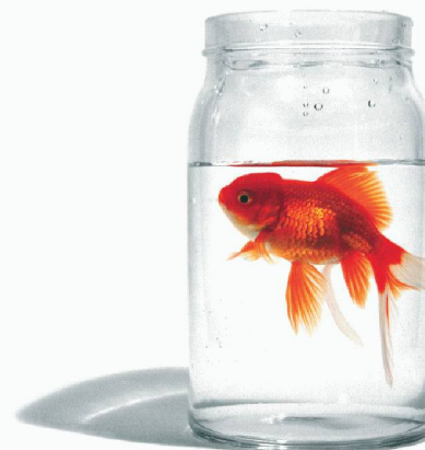
Optimal geschützt?