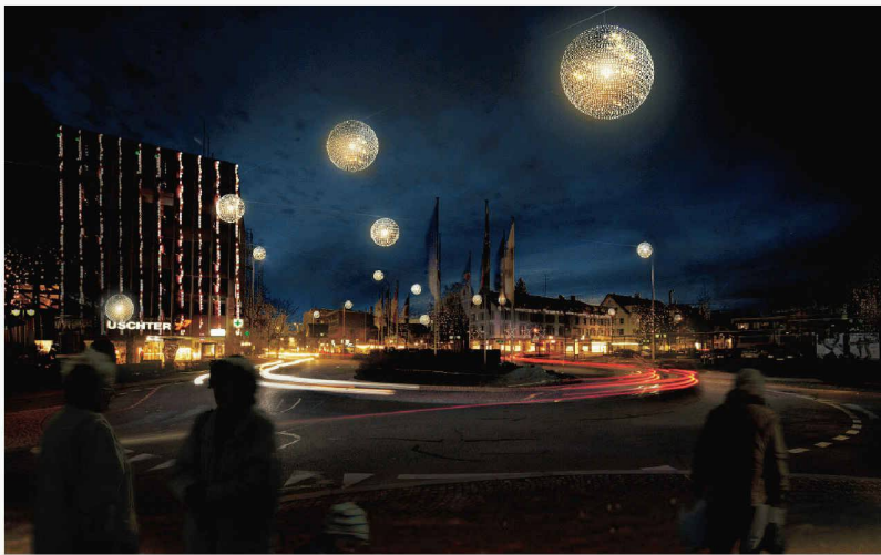
Kugelförmige Leuchten sollen als neue Weihnachtbeleuchtung von Uster Sternbilder bilden (Weiterbearbeitung, oos)