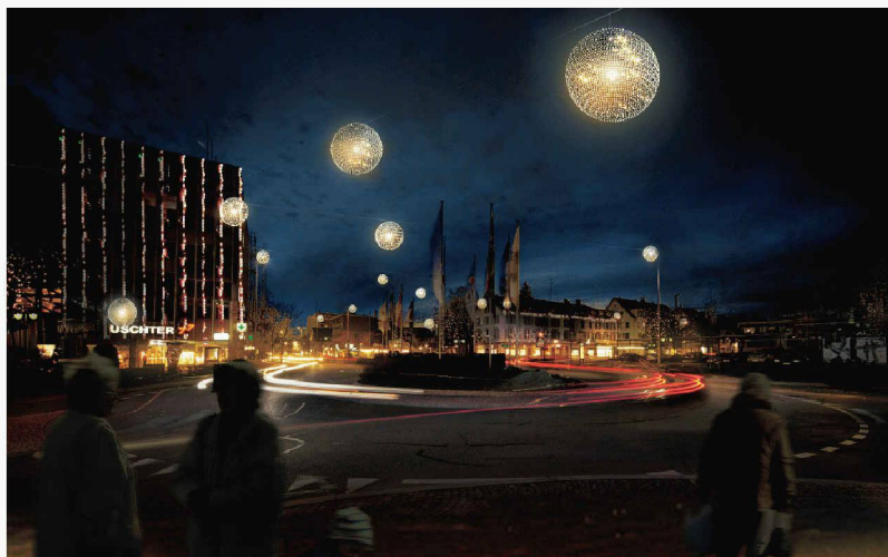
Kugelförmige Leuchten sollen als neue Weihnachtsbeleuchtung von Uster Sternbilder bilden (Weiterbearbeitung, oos)