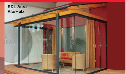
Glashaus mit SL25