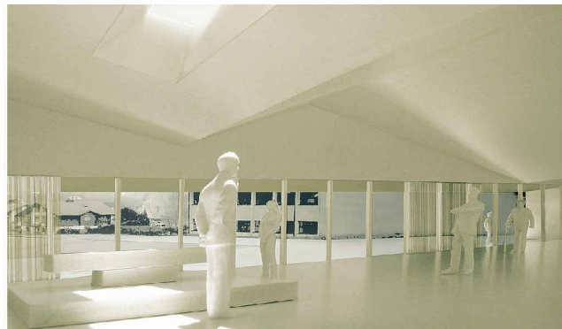
In der neuen Mehrzweckhalle in Ried wird der Weg zum Friedhof optisch durchs Gebäude geführt. Der Hauptraum ist verschieden unterteilbar, zum Beispiel auch für Abdankungen (Weiterbearbeitung, Christoph Gschwind)