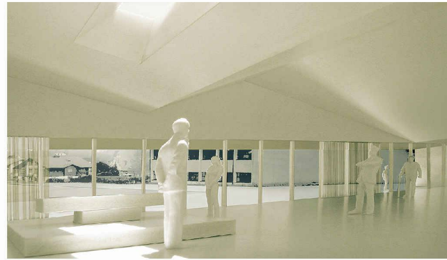
In der neuen Mehrzweckhalle in Ried wird der Weg zum Friedhof optisch durchs Gebäude geführt. Der Hauptraum ist verschieden unterteilbar, zum Beispiel auch für Abdankungen (Weiterbearbeitung, Christoph Gschwind)