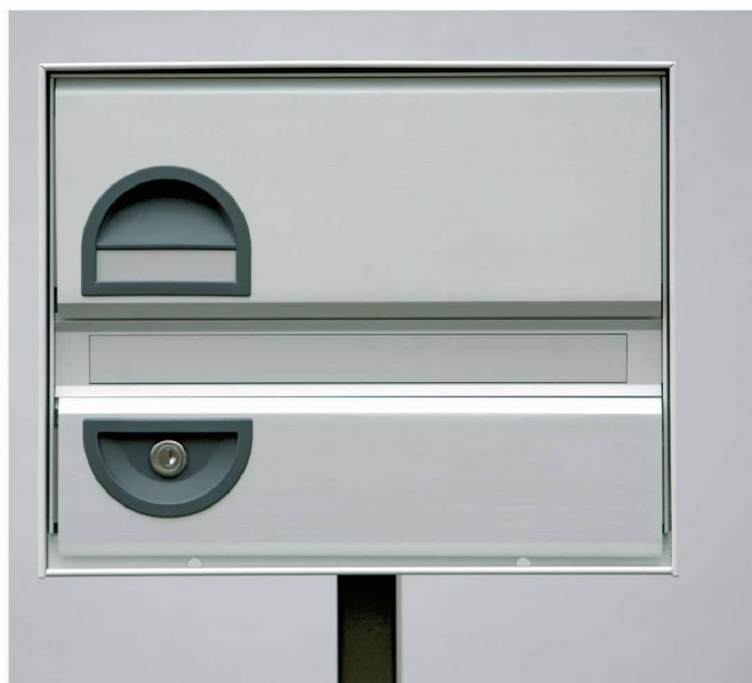
Typ basic B - Einzel - Mittelstütze

Als Spezialist für Briefkästen möchten wir Ihre Ideen und unsere Erfahrungen verbinden, um eine Lösung mit hohem Nutzwert in Funktion, Design und Preis zu erreichen.