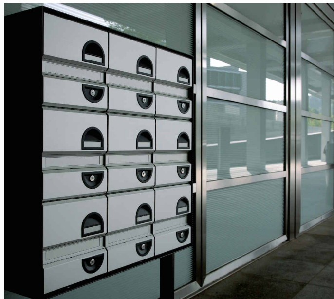
Typ basic S - Gruppe - Seitenstützen