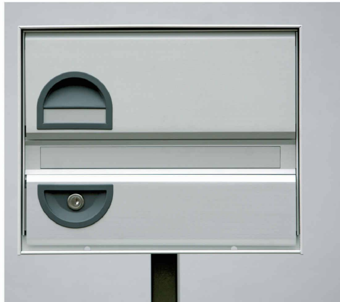
Typ basic B - Einzel - Mittelstütze

Als Spezialist für Briefkästen möchten wir Ihre Ideen und unsere Erfahrungen verbinden, um eine Lösung mit hohem Nutzwert in Funktion, Design und Preis zu erreichen.