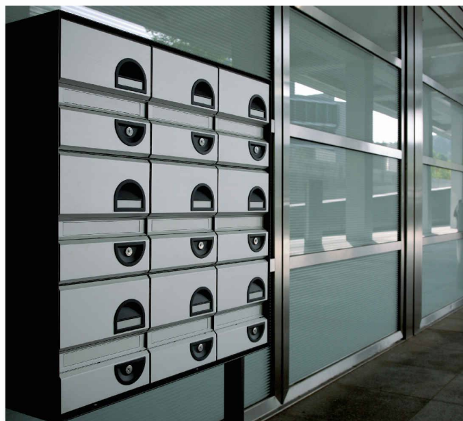
Typ basic S - Gruppe - Seitenstützen