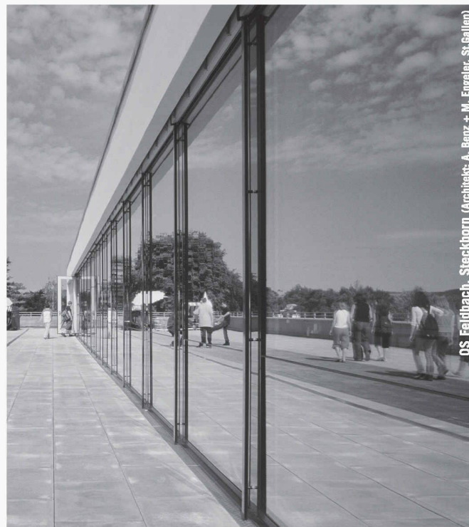
OS Fellbach, Steckborn (Architekt: A. Benz + M. Engeler, St.Gallen)

Partner für anspruchsvolle Projekte in Stahl und Glas