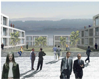
Sicht auf See (Bild: Max Dudler)

(bô) Der Name trifft es genau: «Urbane Insel» nennt das Büro von Max Dudler sein zur Weiterbearbeitung empfohlenes Projekt. Es hat sich im anonymen Studienauftrag mit fünf eingeladenen Büros durchgesetzt, nachdem die Jury es noch zusammen mit dem Vorschlag von Mateja Vehovar und Stefan Jauslin überarbeiten liess. Eine kompakte Form erzeugt eine hohe urbane Dichte und lässt einen Teil des Grundstücks als Freifläche bestehen. Die unverwechselbare charaktervolle Gestaltung schafft, so die Jury, an dieser Lage von hoher Qualität eine wahrnehmbare Adresse. Weiter überzeuge das Projekt aufgrund der qualitätsvollen Wohnungen von hoher Individualität und einer guten Wirtschaftlichkeit. Das 22 000 m 2 grosse Areal Giessen ist heute das Betriebsgelände der