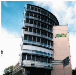
Gewerbe- und Wohnbau