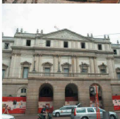
Neubauten in und an bestehenden Bauten

Durch die über 40-jährige Erfahrung und Spezialisierung auf vorbeugende und sanierende Abdichtung gegen drückendes Wasser, sowie ständige Weiterentwicklung der Produkte und Lösungen, können Sie mit RASCOR nur gewinnen.