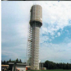
Behälter- und Bäderbau