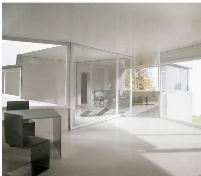
Ein Drittel der Wohnungen sind «Z-Wohnungen», die sich jeweils in zwei Bauten befinden und übereck zusammenhängen (Weiterbearbeitung, Park Architekten und Jan Kinsbergen)