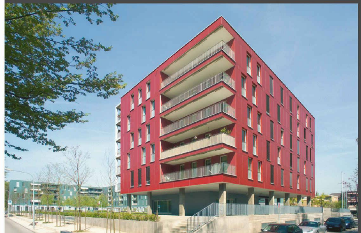
Architekten: Tina Arndt, Daniel Fleischmann, Zürich

Die Wahl des Materials als entscheidendes Element einer konsequenten Umsetzung. SWISSPEARL Faserzementplatten verleihen dem gestalterischen Konzept ein Gesicht. Mit einzigartiger Ausdruckskraft.