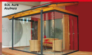
Glashaus mit SL25