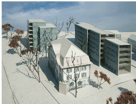
Ein hoher Villentyp und ein längliches Wohn- und Geschäftshaus beim Bahnhof Wohlen (1. Rang, pool Architekten)