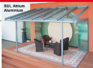
Glashaus mit SL25