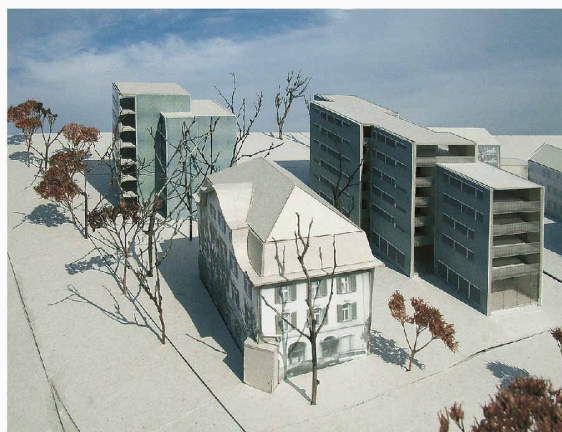
Ein hoher Villentyp und ein längliches Wohn- und Geschäftshaus beim Bahnhof Wohlen (1. Rang, pool Architekten)