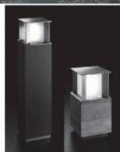
BRIDGE 15 EXTERIOR LIGHTING / AMBIENCE LIGHTING DESIGN DELTA LIGHT