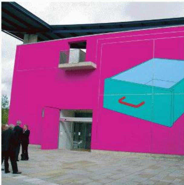
Michael Craig-Martin The Magenta House, Milton Keynes Gallery, London Architekt: Michael Craig-Martin