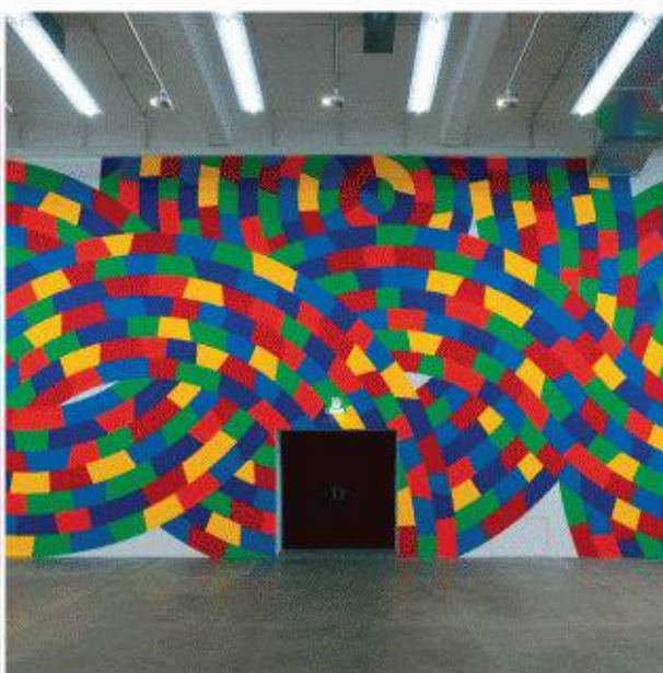
Sol LeWitt The Zurich Project, Haus Konstruktiv, Zürich Künstler: Sol LeWitt