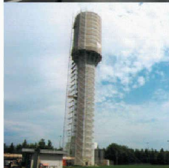
Behälter- und Bäderbau