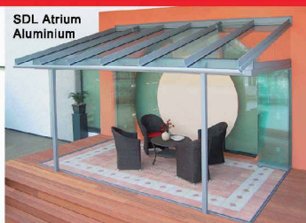
SDL Atrium Aluminium