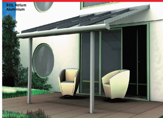
SDL Atrium Aluminium