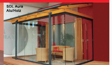
SDL Aura Alu/Holz