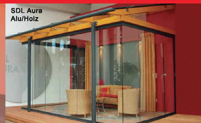
SDL Aura Alu/Holz