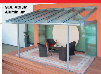
SDL Atrium Aluminium