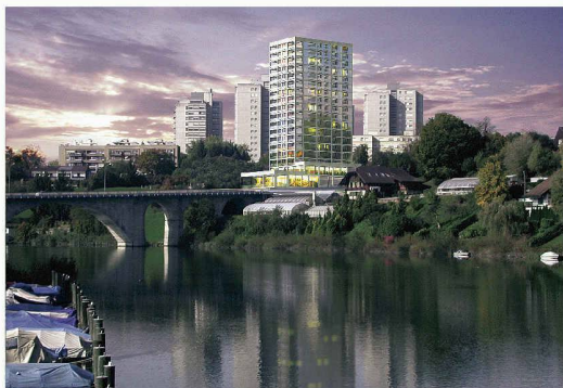
Wohnturm mit Restaurant im Erdgeschoss (Weiterbearbeitung, Bünzli & Courvoisier)

(bö) Die Gemeinde Wohlen gibt sich mutig. Zusammen mit der Moser Bau Immobilien AG, der Investorin und Grundeigentümerin, hat sie einen Studienauftrag durchführen lassen mit dem Ziel, Hinterkappelen qualitativ hoch stehend zu entwickeln. Sechs Architekturbüros konnten teilneh-