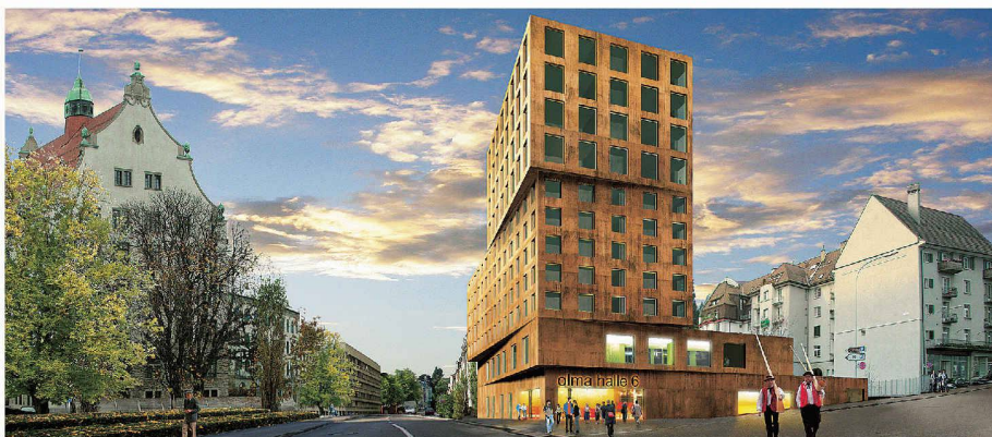
Messe- und Kongresshalle in St. Gallen mit Hotel und Büros (Weiterbearbeitung, bhend.klammer)

Weitere Teilnehmende – Keller Hubacher, Herisau – Voelki Partner, Zürich, und Schlöpfer Nüesch, St. Gallen