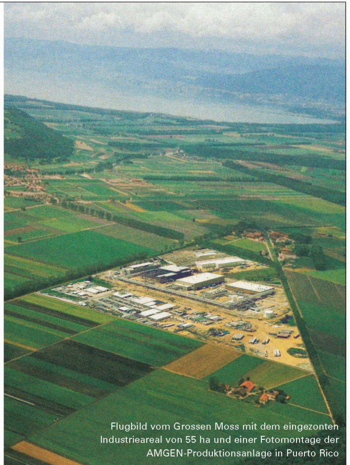
Flugbild vom Grossen Moss mit dem eingezonten Industrieareal von 55 ha und einer Fotomontage der AMGEN-Produktionsanlage in Puerto Rico

E-Mail: galmizgm@w28.ch www.galmizgm.ch Tel. 031 398 25 45