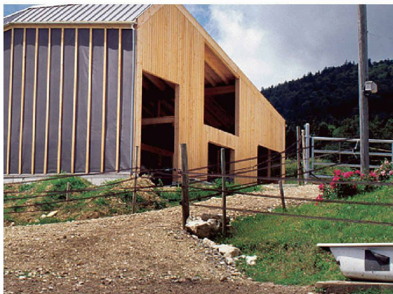
Freilaufstall für 30 Kühe, Lignières NE. Local Architecture, Lausanne

Auszeichnung wurde für einen Pavillon in der Stadt St. Gallen gesprochen, ein kleines Gebäude, das sich mit Farbe, einladender Gestaltung und einem in die Fassade integrierten Streckenplan aus LED-Leuchten wie eine freundliche Visitenkarte der städtischen Verkehrsbetriebe St. Gallen gibt.