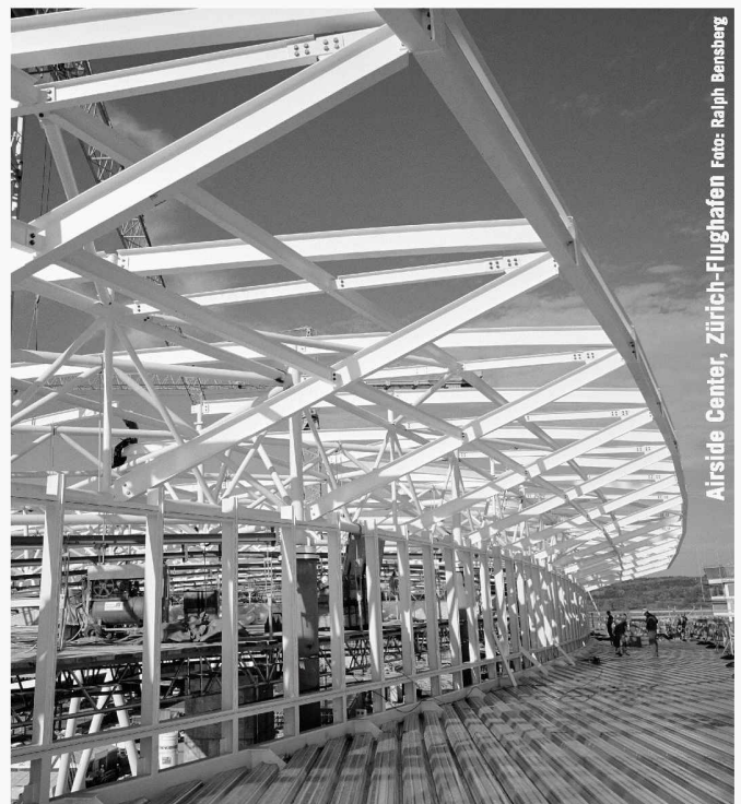
Airside Center, Zürich-Flughafen

Partner für anspruchsvolle Projekte in Stahl und Glas