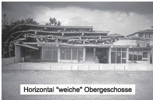
Horizontal "weiche" Obergeschosse