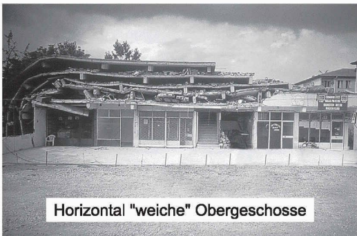
Horizontal "weiche" Obergeschosse