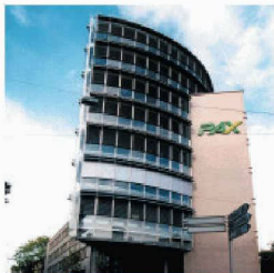
Gewerbe- und Wohnbau