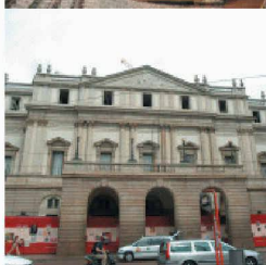
Neubauten in und an bestehenden Bauten

Durch die über 40-jährige Erfahrung und Spezialisierung auf vorbeugende und sanierende Abdichtung gegen drückendes Wasser, sowie ständige Weiterentwicklung der Produkte und Lösungen, können Sie mit RASCOR nur gewinnen.