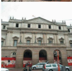
Neubauten in und an bestehenden Bauten

Durch die über 40-jährige Erfahrung und Spezialisierung auf vorbeugende und sanierende Abdichtung gegen drückendes Wasser, sowie ständige Weiterentwicklung der Produkte und Lösungen, können Sie mit RASCOR nur gewinnen.