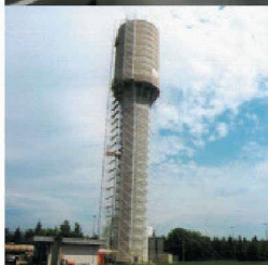
Behälter- und Bäderbau