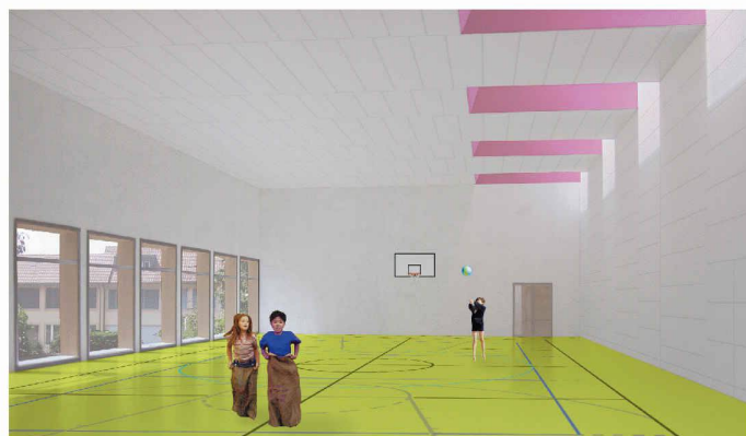
Neue und im Innern farbige Mehrzweckhalle für Dättlikon (1. Rang, Schneider & Gmür)