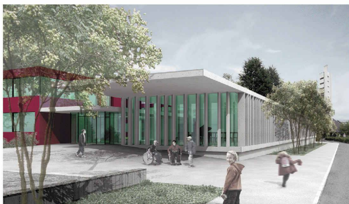
Mit einem neuen Längstrakt aus stehenden Betonelementen soll das Schulheim Rossfeld in Bern öffentlicher werden (1. Rang, Aebi & Vincent)