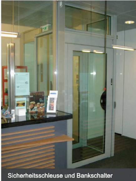
Sicherheitsschleuse und Bankschalter