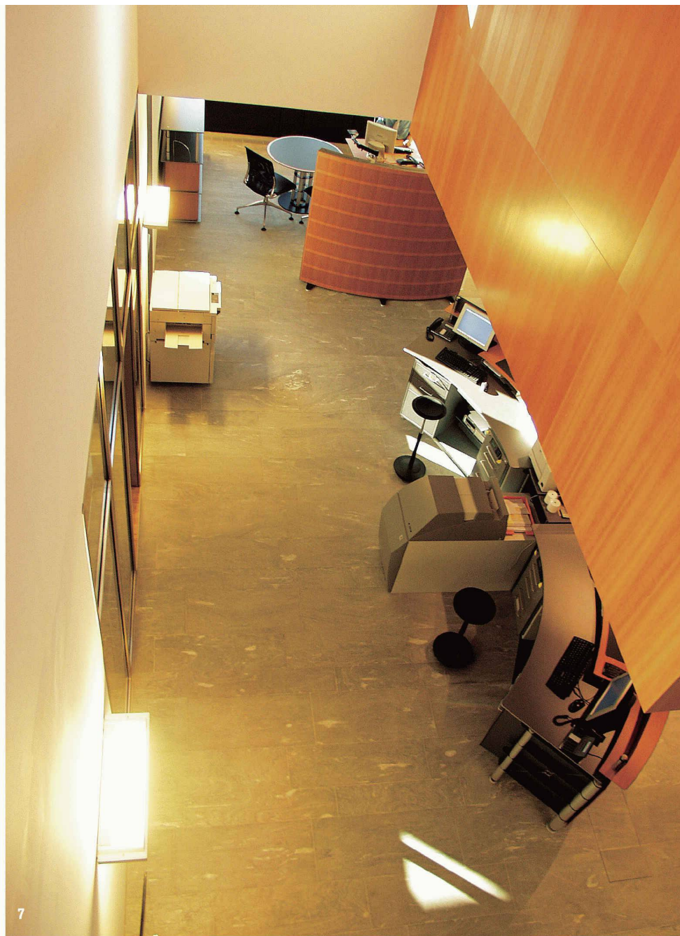
7 Coup d'œil sur le hall d'accueil de la clientèle, réparti sur deux étages