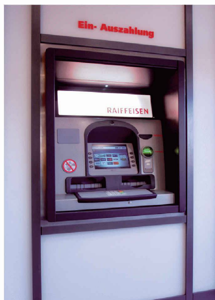
NCR Personas 76-M, Indoor 24h-Zone

Für weitere Informationen: Abteilung FSD, Self Service Solutions Ernst Imhof, Tel. 044 832 14 16 ernst.imhof@ncr.com