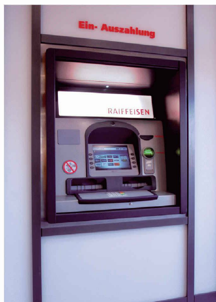
NCR Personas 76-M, Indoor 24h-Zone

Für weitere Informationen: Abteilung FSD, Self Service Solutions Ernst Imhof, Tel. 044 832 14 16 ernst.imhof@ncr.com