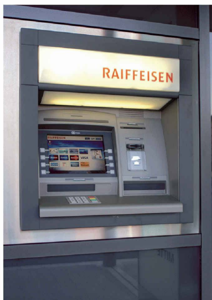
NCR Personas 86-M, Outdoor