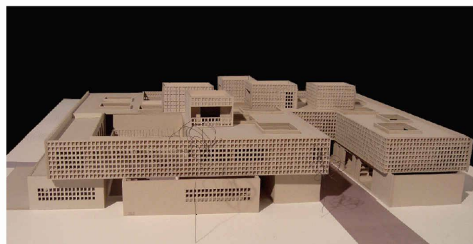
Vue latérale de la maquette

Le projet propose une grande structure de forme précise qui contient divers types d'hébergements touristiques ainsi qu'un centre de bien-être. Il s'impose comme un centre repérable dans la nature environnante. La typologie de ce grand bâtiment s'inspire de la structure urbaine du village voisin et la décline avec habileté pour la rendre contemporaine et répondre aux exigences du tourisme actuel. L'indéniable dextérité des diplômés avec le jeu des volumes, des pleins et des vides dans l'élaboration du bâtiment a conquis le jury, avec comme seul regret que les aménagements extérieurs aient été peu valorisés.