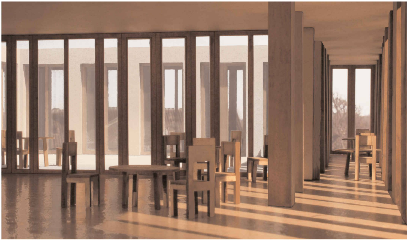
Die Cafeteria wurde nach lichttechnischen und akustischen Kriterien hierarchisch geschichtet