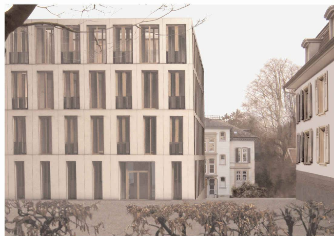
Das Areal des Englischen Seminars mit dem Neubau