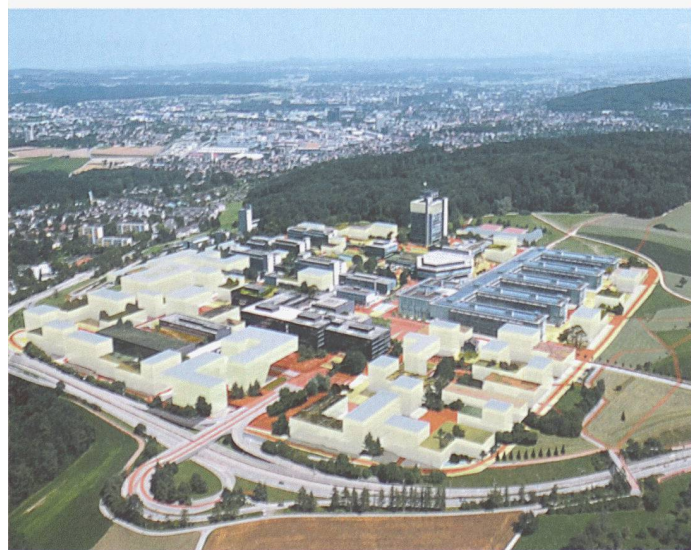
Entwurf Hochschulcampus «Science City», ETH Zürich und KCAP Rotterdam, 2005