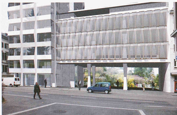
Der vorgesehene Neubau des Nebengebäudes Selnastrasse 12 gibt den Durchblick zum Park des ehemaligen Botanischen Gartens frei

Ausgeschrieben war ein Studienauftrag für einen umfassenden, guten, architektonisch überzeugenden, auf Nachhaltigkeit ausgerichteten und ganzheitlichen Vorschlag. Das Hauptaugenmerk sollte auf den Fassaden, den Eingangspartien sowie den energetischen und technischen Einrichtungen liegen. Für den Studienauftrag konnten sich Planerteams mit mindestens einem Architekten, einem HLKS- und einem Bauingenieur, alle Mitglieder des SIA, und einem Bauphysiker mit Firmensitz in der Schweiz bewerben.