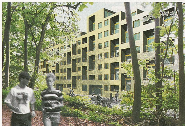
Der lang gestreckte Wohnriegel mit doppelgeschossigen Loggien liegt direkt am Wald (2. Rang, atelier 10:8)