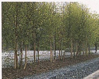
Schotterplatz und Birkenreihen auf dem Zürcher Lettenareal weisen auf historische und räumliche Eigenheiten des Gebiets hin und sind Lebensraum für Eidechsen

(ce/pd) Das Areal Oberer Letten am rechten Limmatufer hat sich bald nach Auflösung der offenen Drogenszene 1995 zu einem beliebten Naherholungsraum mitten in der Stadt Zürich entwickelt. Das Gebiet ist eine bunte Mischung aus Naturraum, Freibad, Sportfeld und Gastrobetrieb. Das Areal wurde jetzt neu gestaltet, der Zugang zum Wasser sowie die Bedingungen für den Fuss- und Veloverkehr wurden optimiert – aber auch der Lebensraum von Tieren und Pflanzen konnte stark verbessert werden.