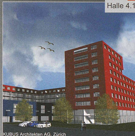
KUBUS Architekten AG, Zürich