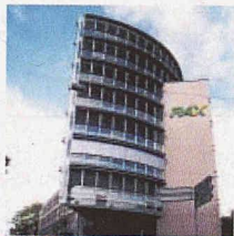
Gewerbe- und Wohnbau