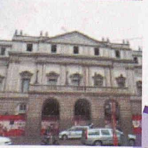
Neubauten in und an bestehenden Bauten

Durch die über 40-jährige Erfahrung und Spezialisierung auf vorbeugende und sanierende Abdichtung gegen drückendes Wasser, sowie ständige Weiterentwicklung der Produkte und Lösungen, können Sie mit RASCOR nur gewinnen.