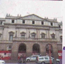
Neubauten in und an bestehenden Bauten

Durch die über 40-jährige Erfahrung und Spezialisierung auf vorbeugende und sanierende Abdichtung gegen drückendes Wasser, sowie ständige Weiterentwicklung der Produkte und Lösungen, können Sie mit RASCOR nur gewinnen.