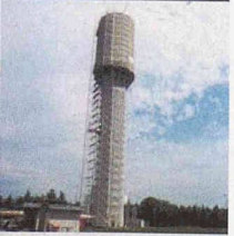
Behälter- und Bäderbau