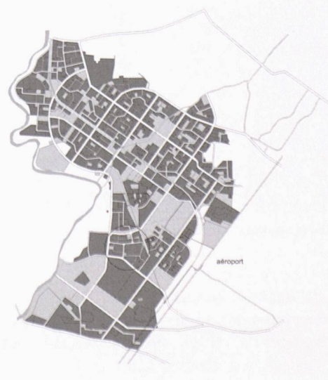
Plan de situation de la ville nouvelle