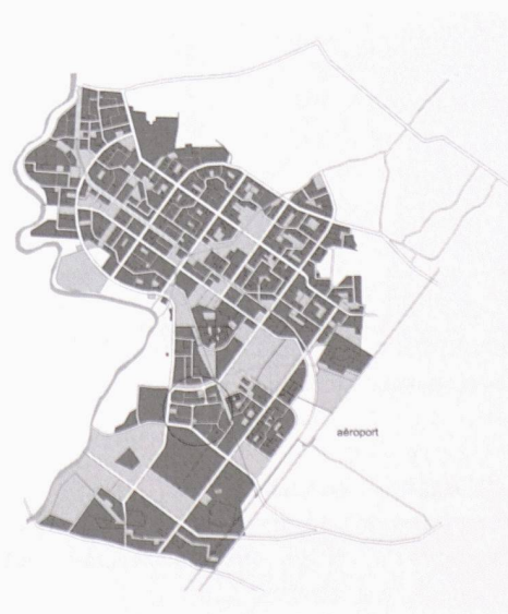
Plan de situation de la ville nouvelle