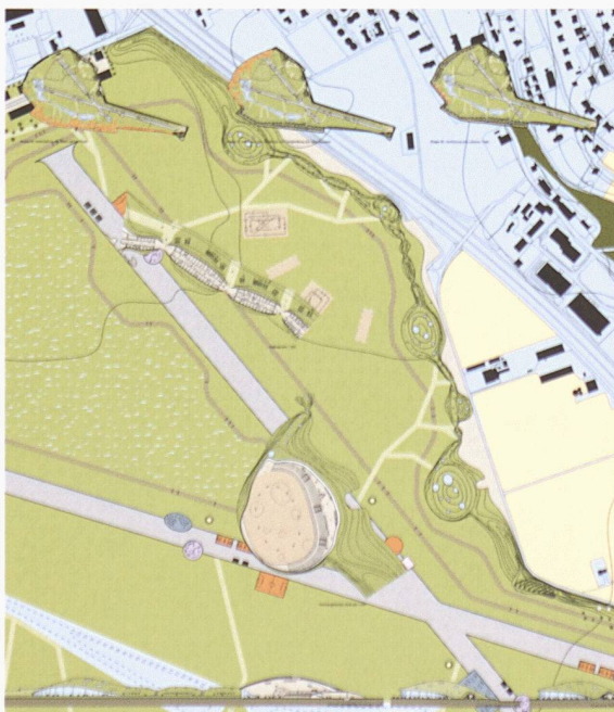
Landschaftlicher Wall und urbaner Wall

jektautorin die kontrastierende Massstäblichkeit zur umgebenden Bebauung auch bei einer Neunutzung zu erhalten. Das Projekt gliedert sich in einer logischen Schichtung von Ringen. Den äussersten Ring bildet ein Wall, der die bauliche Masse aufnimmt. Auf der städtischen Seite im Süden und Westen soll er ein Aussern der Siedlungsstruktur verhindern. Es ist ein urbaner Gürtel, der durch seine Dichte und Nutzung auf die Attraktivität der jeweiligen Lage sowie auch auf sein Gegenüber reagiert. Im Innern des Areals werden verschiedene Freizeitnutzungen vorgeschlagen. Diese werden in dichtere Bereiche zusammengefasst und frei in das «Meer aus Wiesen und Blumen» gestellt.