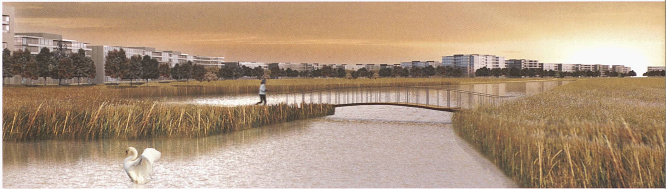
Hallengruppe für verschiedene Freizeiteinrichtungen und landschaftlich aufgewertete Auenlandschaft als Naherholungspark