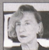
Riken Yamamoto Yokohama