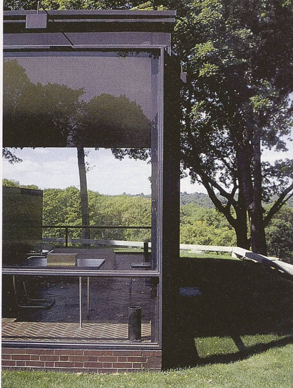
Philip Johnsons «Glass House» in New Canaan von 1949, Zeuge «architektonischer Kleptomanie» (Charles Jencks): Johnson nannte selber 17 Quellen für das Haus, u. a. Le Corbusier (Lageplan), van der Rohe (Durchdringung der Volumen), van Doesburg (asymmetrische Komposition), Schinkel (Symmetrie)