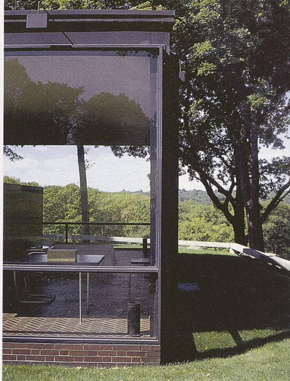
Philip Johnsons «Glass House» in New Canaan von 1949, Zeuge «architektonischer Kleptomanie» (Charles Jencks): Johnson nannte selber 17 Quellen für das Haus, u. a. Le Corbusier (Lageplan), van der Rohe (Durchdringung der Volumen), van Doesburg (asymmetrische Komposition), Schinkel (Symmetrie)

Der Atlas der Schweiz ist auf CD-ROM oder DVD erhältlich und benötigt folgende Hardware: Apple Macintosh ab MacOS 9 oder PC ab Windows 98. Mindestens 128MB RAM und ein Farbmonitor mit mindestens 1024 × 768 Bildpunkten sind erforderlich. ISBN 3-302-09522-8 (DVD) resp. 3-302-09521-X (CD-ROM), 248Fr., Bezug per E-Mail: order@atlasofswitzerland.ch