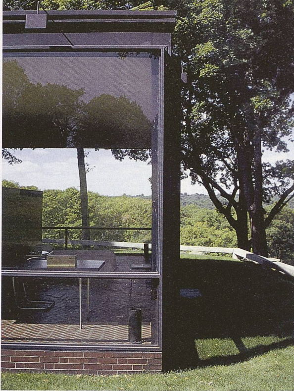
Philip Johnsons «Glass House» in New Canaan von 1949, Zeuge «architektonischer Kleptomanie» (Charles Jencks): Johnson nannte selber 17 Quellen für das Haus, u. a. Le Corbusier (Lageplan), van der Rohe (Durchdringung der Volumen), van Doesburg (asymmetrische Komposition), Schinkel (Symmetrie)