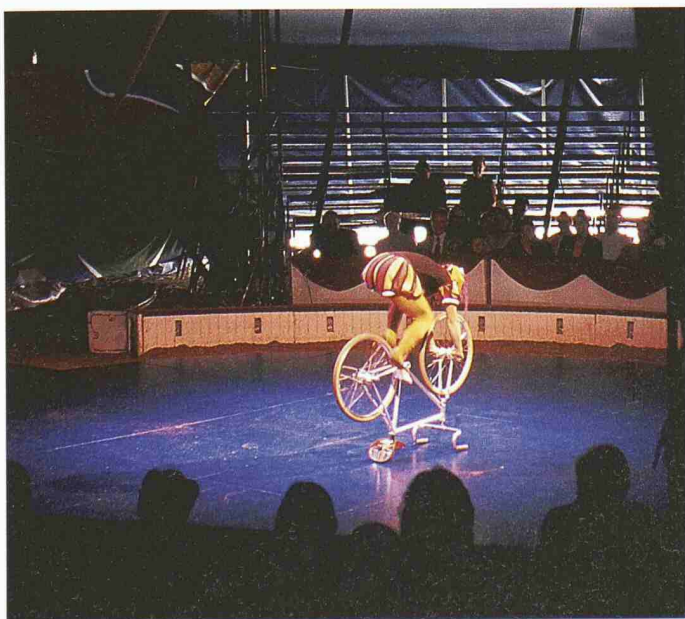
Das hoch stehende artistische Niveau des Circus Monti begeisterte die Gäste der SIA-Gala in Zürich

(Auszug aus der Begrüssung von Daniel Kündig, Präsident SIA, an der Gala-Vorstellung des Circus Monti vom 30. September für ehrenamtlich Tätige im SIA.)