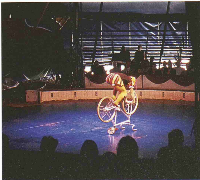
Das hoch stehende artistische Niveau des Circus Monti begeisterte die Gäste der SIA-Gala in Zürich

(Auszug aus der Begrüssung von Daniel Kündig, Präsident SIA, an der Gala-Vorstellung des Circus Monti vom 30. September für ehrenamtlich Tätige im SIA.)