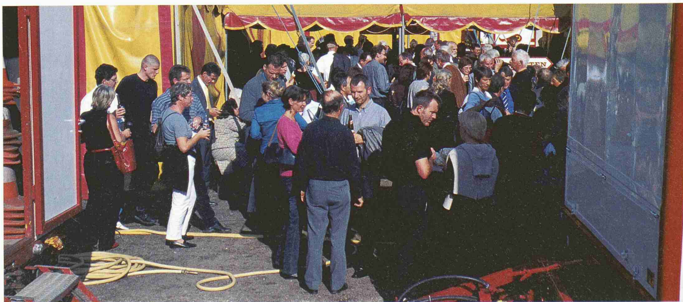
Gegen 400 Gäste folgten der Einladung an die Gala-Vorstellung des SIA im Circus Monti (Bilder: Reinhard Zimmermann)

Der Anlass gibt mir die Gelegenheit, Ihnen allen im Namen der Direktion persönlich zu danken für all das, was Sie in den SIA eingebracht haben, und Ihnen wenigstens symbolisch unsere Wertschätzung Ihrer Mit-