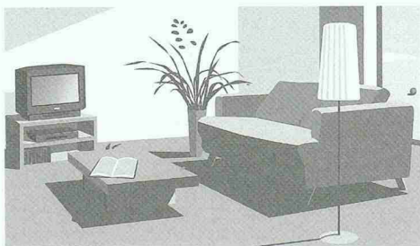
Christian Vetter, „Dieses schöne Leben: Wohnzimmer“ 15-farbiger Siebdruck, 2001, 36,5 x 62 cm, Fr. 240.-

Tür oder Tor stellen die Visitenkarten eines jeden Gebäudes dar. Um so wichtiger sind individuelle Lösungen. Wir verstehen uns als Partner Ihrer Wünsche und als Toröffner für deren Realisation. Ob eigene Produktion, Service oder Reparatur, Entwicklung von Antrieben oder Erstellen einer Gesamtkonzeption: DARO TOR berät Sie in allen Belangen rund um Tür und Tor.