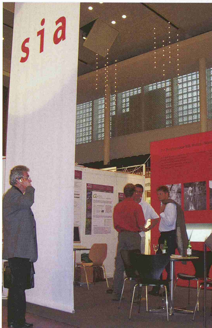
Der Stand des SIA bot den Fachvereinen der Berufsgruppe Boden/Wasser/Luft Gelegenheit, ihre Leistungen zu zeigen und mit Interessenten Kontakte anzubahnen

Die der Berufsgruppe angehörenden neun Fachvereine, nämlich der Bund Schweizer Landschaftsarchitekten und -architektinnen, der Schweizer Geologen Verband, die Fachgruppen für Arbeiten im Ausland, für Brückenbau und Hochbau, für Untertagbau, der Fachverein der Kultur-, Geomatik- und Umweltingenieure, der Fachverband Schweizer Raumplanerinnen und Raumplaner, der Fachverein Wald und der Schweizerische Verband der Umweltfachleute waren am Stand des SIA vertreten. Dort lag auch der neue Prospekt auf, der das Leitbild der Berufsgruppe sowie den Zweck und die Ziele jedes Fachvereins kurz vorstellt und die Anlaufstellen nennt.