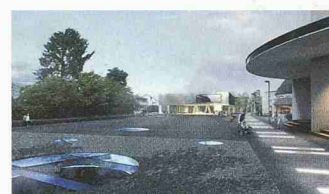
Gut proportionierte Freiräume (2. Rang, raumgleiter)

Lichtdesign, St. Gallen; L. Saurer Landschaftsarchitekten, Bern