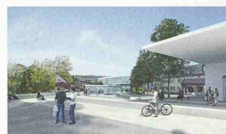
Grosszügiges neues Zentrum (1. Rang, Durrer Linggi Schmid)