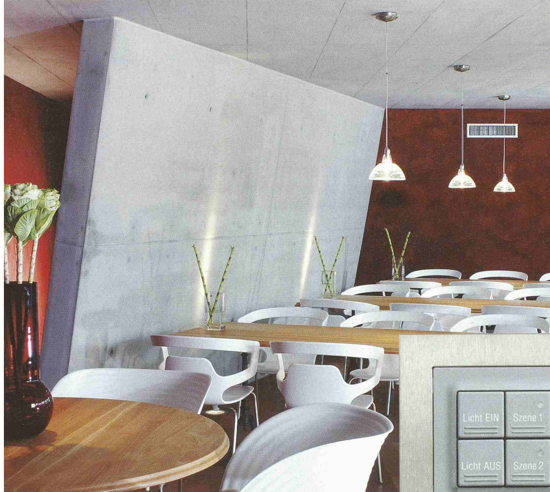
Interior Design by Carlo Borer.ch