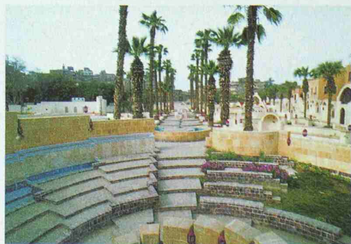
Die Palmen-Allee im Kinderkulturpark in Kairo, 1983–1992; Architekt: Abdelhalim I. Abdelhalim

Formen den Niavarán-Park in Teheran, und Abdelhalim I. Abdelhalim entwickelte die Farafrá Oase im Süden Ägyptens und einen Kinderkulturpark in Kairo nach traditionellen Mustern und zeitgenössischen Anforderungen. Die ifa-Galerie Stuttgart stellt Projekte dieser Architekten – von der Stadt- und Oasenplanung bis zur Gestaltung privater Gärten – in Form von Plänen, Skizzen, Fotos und Filmen vor. Eröffnung: Do, 2.9., 18 h. Ausstellung: 3.9.–7.11., Di–Fr 12–18 h und Sa+So 11–16 h. Auskunft: Tel. +49 711 2225 173 oder www.ifa.de.