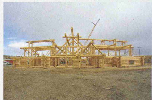
Die traditionelle Blockbauweise wird in Kanada immer noch praktiziert und weiterentwickelt

Die Holzbaureise findet statt vom 23. bis zum 30. Oktober 2004. Die Anmeldung ist möglich bis Ende August bei Werner Naef von der kanadischen Botschaft in Bern. Telefon 031 357 32 06. werner.naef@dfait-maeci.gc.ca