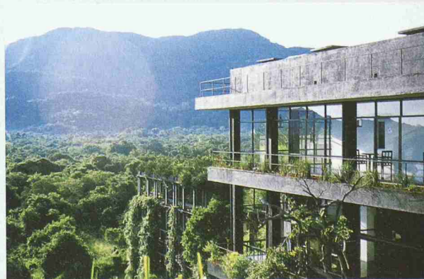
Kandalama Hotel Dambulla (1991) von Geoffrey Bawa. Das Deutsche Architektur Museum zeigt ab 24. Juli die Ausstellung: «Bawa – Genius of the place. An Architect of Sri Lanka.»

Häuser greifen in die Landschaft hinein, die Natur verbindet sich mit einem Bau zu einem eigenen Raum. Geoffrey Bawa starb 2003. Das Deutsche Architektur Museum (DAM) in Frankfurt am Main zeigt in einer grossen Ausstellung erstmals das gesamte Werk Bawas, in Plänen, Fotos, Modellen, Filmen und Möbeln. Die Ausstellung inszeniert das originale Ambiente mit Stoffen, Kunst und Materialien aus Sri Lanka. Sie beginnt am 24. Juli und dauert bis 17. Oktober. Öffnungszeiten: Di–So 10–17 h, Mi 10–20 h. Führungen: Sa + So, 15 h. Infos: www.dam-online.de oder Tel. +49 69 21 23 88 44.