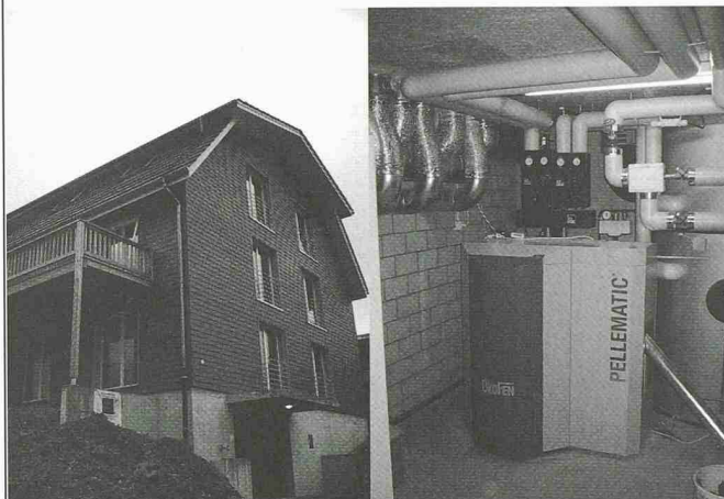
MFH Gebrüder Bohrer, Oberwil im 2002